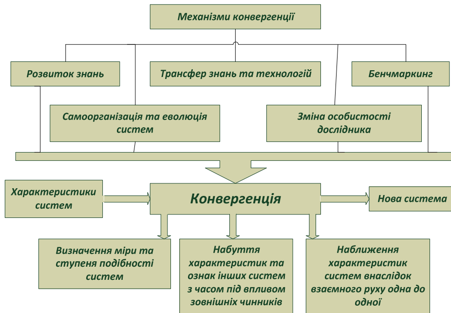
Рисунок 1 – Механізми та методи конвергенції систем