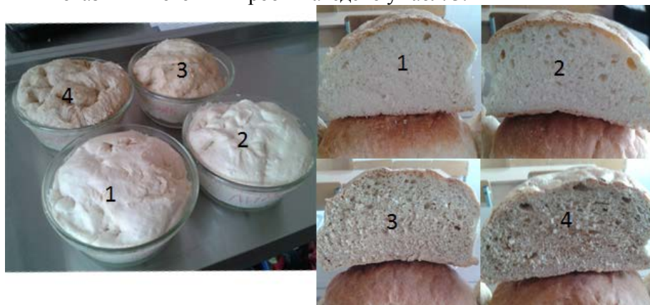
Рис. 2. Тісто та хліб після випічки: 1 – без добавок; 2 – з добавкою соку лимона; 3 – з добавкою цикорію; 4 – з добавкою кави

хлібом з соком лимона (в якого м'якуш має світліший відтінок порівняно з контрольним зразком). Смак і запах хліба з кавою – приємні, з ледь помітними відтінками смаку і запаху кави, а з добавкою цикорію та лимонного соку – властиві пшеничному хлібу. Результати дослідження фізико-хімічних показників готових виробів наведено у табл. 3.