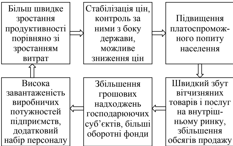
Рис. 4.3. Модель зростаючої продуктивності

Провідна роль у цьому процесі повинна належати уряду країни, який, на жаль, нерідко невмотивований й дуже часто не має на вирішення екологічних та соціальних проблем грошей. Шкоди завдає й бізнес, який у гонитві за прибутком часто забуває про соціальну відповідальність бізнесу.