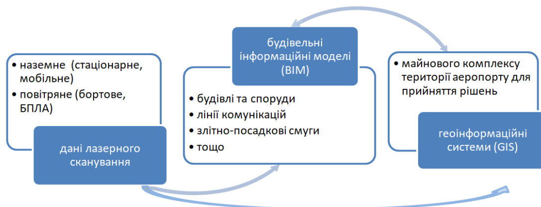
Рис. 2. Концептуальна схема інтеграції геопросторових даних території аеропорту в BIM та GIS системи

Для первинної обробки, геоприв'язки та «зшивки» отриманих хмар точок використовуються програмні комплекси типу Cyclone-REGISTER от Leica Geosystems. Додатково на цьому етапі робіт є можливість сформувати карту сферичних панорам об'єкта, яка дозволяє проглядати панорами з будь-якої станції сканування, а також проводити виміри, залишати анотації тощо. Отримана хмара точок експортується для подальшої обробки в програмний продукт, типу Autodesk ReCap, який містить велику кількість налаштувань для керування хмарию (видалення точок, редагування інтенсивності кольору тощо) і дозволяє вийти на необхідний рівень деталізації для побудови BIM-моделі.