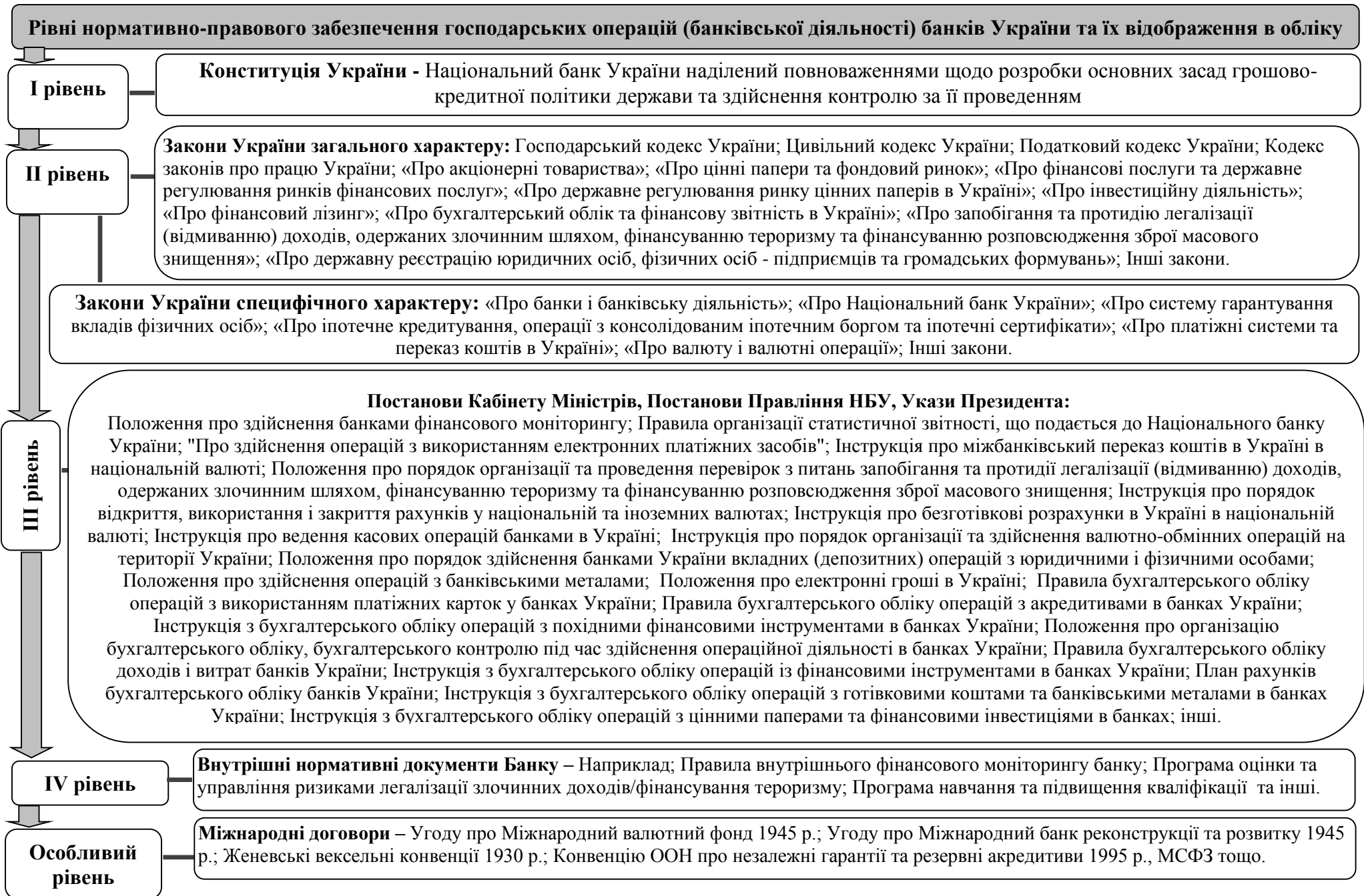
Рис. 1 – Рівні нормативно-правового забезпечення банківської діяльності банків України