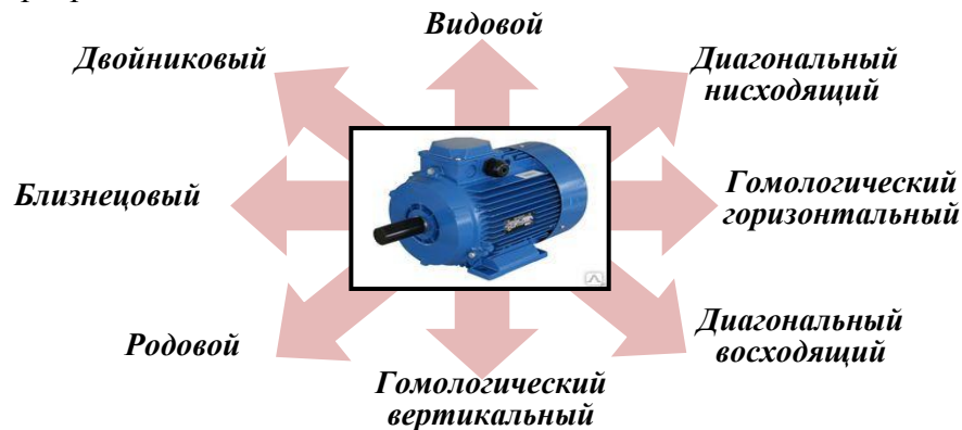
Рис. 3 – Произвольный технический объект через эффект «генетической памяти» содержит генетическую информацию о всех генетически допустимых рядах параллельного структурообразования

Достоверность теоретических положений проверялась постановкой эволюционных экспериментов. В результате проведенных геномно-исторических экспериментов, выявлены структурные представители всех структурных рядов, включая близнецовые и двойниковые Виды объектов, а также гомологические ряды вертикального и горизонтального типов. Более значимыми являются результаты геномно-прогностического уровня, по результатам которых осуществлялось предвидение и целенаправленный ввод в техническую эволюцию новых, конкурентоспособных объектов близнецовых, гибридных и гомологических видов, впервые синтезированных по их генетическим программам [3,4].