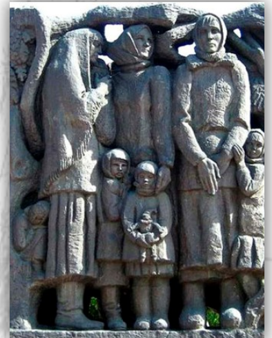
Ілюстрації з мережі інтернет