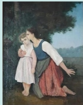
Мати і дитина (Л. Українка, 1893 р.)

Талант Лесі Українки виявився у багатьох різновидах. Леся Українка мала абсолютний слух та надзвичайний талант до музики. Також вона чудово малювала (в тому числі й морські пейзажі); деякий час брала уроки у Київській рисувальній школі Олександра Мурашка. Її називали першою мариністкою в українському мистецтві. На жаль, збереглася лише одна картина Лесі Українки олійними фарбами. Леся Українка неабияк підтримувала емансипацію та жіночі рухи задля більших можливостей жіночої самореалізації. В цьому вона пішла стопами своєї матері Ольги Косач, яка теж була активісткою українського жіночого руху. Героїні творів Лесі Українки – вільні у своєму виборі, самодостатні, горді та незалежні жінки – для сучасників поетеси стали абсолютним викликом.