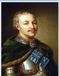
ДОБА ГЕТЬМАНА ІВАНА МАЗЕПИ Рекомендаційний список

Доба гетьмана Івана Мазепи : рекомендаційний список / уклад. С. Л. Бондар. – Чернігів : Наукова бібліотека НУ «Чернігівська політехніка», 2023. – 8 с.