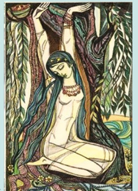
Мавка (С. Караффа-Корбут)

Наукова бібліотека НУ "Чернігівська політехніка" отримала Повне академічне зібрання творів Лесі Українки у 14 тт., яке видано до 150-ти річчя від дня народження великої поетеси.