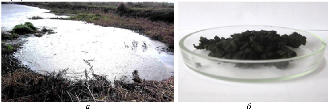
Рис. 4. Осад після біологічного очищення стічних вод: новоутворений осад на муловому майданчику (а) та осад, витриманий 12 місяців на муловому майданчику (б)

Для того, щоб дослідити безпечність для використання у сільському господарстві й будівництві АМ проведено дослідження ймовірної токсичності води, яка проходить крізь свіжий осад та осад після витримки у 12 місяців на мулових майданчиках і потрапляє у ґрунти. Для аналізу відбирали осад з мулових майданчиків (ОММ), який має вигляд, представлений на рис. 4.