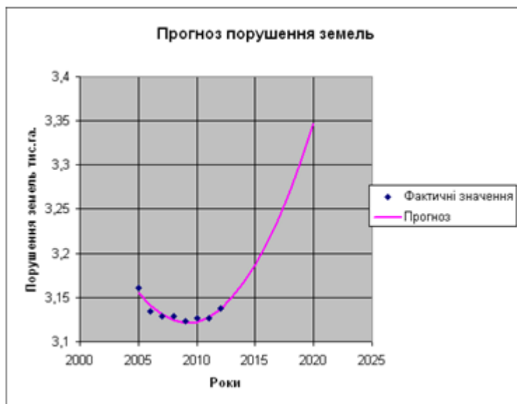
Рис. 3. Зміна кількості порушених земель – фактична і прогнозна

Виявлена тенденція зростання кількості порушених земель потребує активного пошуку зменшення антропогенного тиску на землі. Зокрема, одним із напрямів є проведення досліджень з виявлення можливості утилізації вмісту мулових майданчиків, які з кожним роком займатимуть усе більші площі (рис. 3).